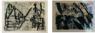
1 Linolschnitt, WV 1014 (1958), 1 Japantusche (1962), 6 Kaltnadel- radierungen (1967), WV988-999