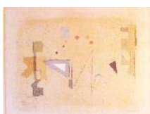
Fröhliches Spiel, 1972 WV 604, Monotypie, Aquarell und Tempera auf Papier