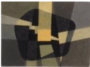
Wege ins Zentrum (Bild No. 28) WV 405, 1964, 34x45,3 cm, Öl auf Spannplatte