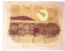
Aquarell Nr. 27, WV 589, Monotypie, Aquarell und Tempera auf Japanpapier