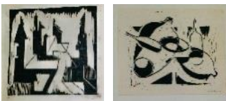
Häuser, WV 1008, 1957, Linolschnitt, Aufl.: 6 gedruckte Ex. Handdruck des Künstlers