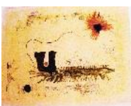
Monotypie, Aquarell und Tempera auf Japanpapier, 1970, rücks.: Widmung an Dr. Köbberling