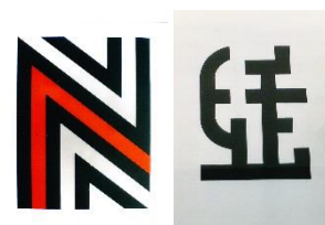
Druckgrafiken aus der Mappe von 1973

Lyrisches Das Spiel Haus Dynamisch Begegnung