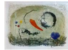
Kompositions-Studie, 1967 Monotypie, Aquarell und Tempera auf Papier