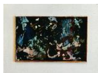
Ölstudie auf Glas