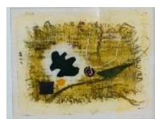
Seltsame Tiere, 1967 WV 586, Monotypie, Aquarell und Tempera auf Japanpapier