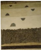
Raumkomposition (Bild No. 73) WV 455 1966, 70,8x55,7 cm, Mischtechnik auf Hartfaser