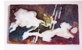
Kompositions-Studie, Öl und Tempera auf Holzplatte