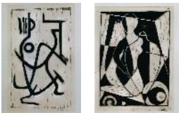
Akt im Raum I, WV 1021, Linolschnitt, Aufl.: 2 Ex und 1 Pro- bedruck, Handdruck des Künstlers