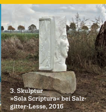
3. Skulptur »Sola Scriptura« bei Salzgitter-Lesse, 2016