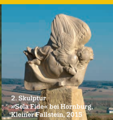
2. Skulptur »Sola Fide« bei Hornburg, Kleiner Fallstein, 2015