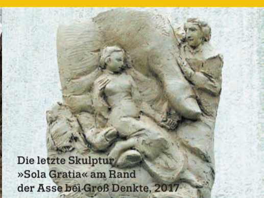
Die letzte Skulptur »Sola Gratia« am Rand der Asse bei Groß Denkte, 2017