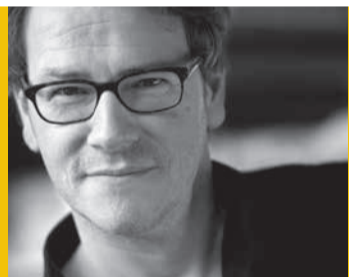
Oliver Bottini, Autor

Fr., 3.11., 19 Uhr »Der Tod in den stillen Winkeln des Lebens« von Oliver Bottini