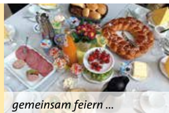
gemeinsam feiern ...