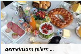
gemeinsam feiern ...