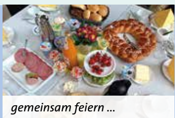
gemeinsam feiern ...