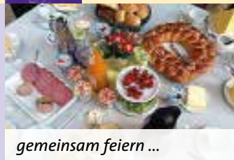
gemeinsam feiern ...

»Die Karin und Joachim Prüsse Stiftung bewahrt und unterhält die denkmalgeschützten jakob-kemenate und kemenate-hagenbrücke und fördert Kunst- und Kultur in Braunschweig.«