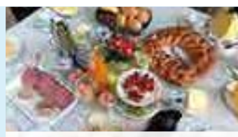
gemeinsam feiern ...

„ Die Karin und Joachim Prüsse Stiftung bewahrt und unterhält die denkmalgeschützten jakob-kemenate und kemenate-hagenbrücke und fördert Kunst- und Kultur in Braunschweig. “