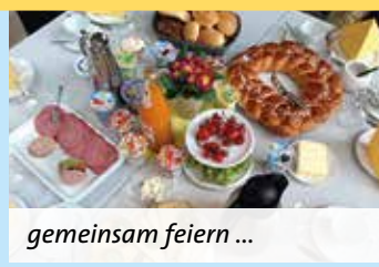
gemeinsam feiern ...

Die Karin und Joachim Prüsse Stiftung bewahrt und unterhält die denkmalgeschützten jakob-kemenate und kemenate-hagenbrücke und fördert Kunst- und Kultur in Braunschweig.