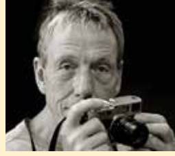
Auf den Spuren der Postschiffe von Bergen bis zum Nordkap