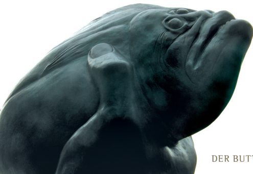
DER BUTT VON GÜNTER GRASS IM HOF DER KEMENATE

Bei Vorlage des Niedersachsen-Tickets (bis 5 Personen) und Niedersachsen-Ticket-Single bekommen die Inhaber 2 € Rabatt auf den Eintritt der Günter Grass Ausstellung in Braunschweig pro Person sowie 1 Ausstellungskatalog je Niedersachsen-Ticket.