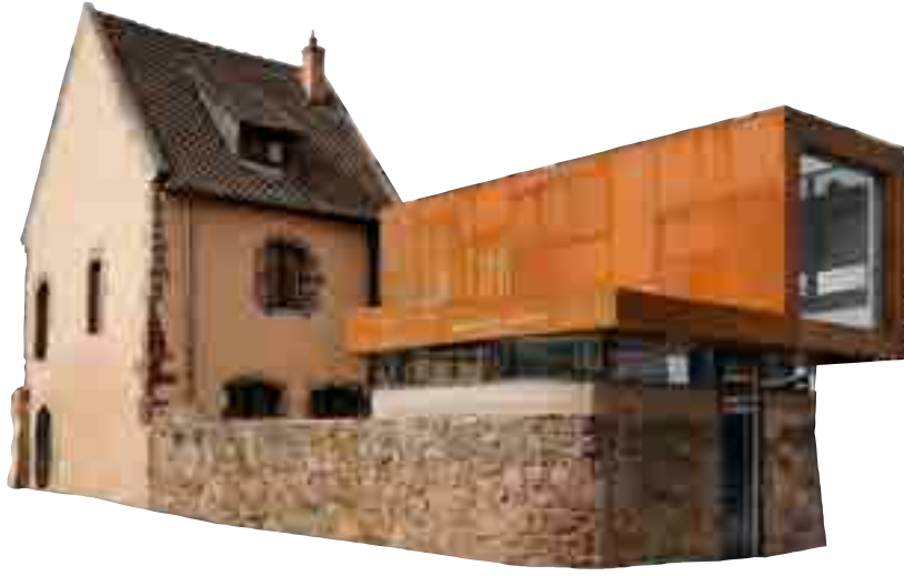
Die kemenate hagenbrücke heute