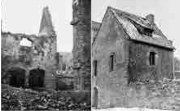
kemenate hagenbrücke im Jahr 1945 und 1951

Die kemenate hagenbrücke wurde im 13. Jahrhundert errichtet und ist wegen ihrer besonderen geschichtlichen Bedeutung als Baudenkmal geschützt. Sie wird künftig der Öffentlichkeit zugänglich gemacht und Raum bieten für vielfältige kulturelle Projekte, z. B. Ausstellungen. Das rund 750 Jahre alte Steinhaus soll aber nicht nur als Hülle für die neuen Aktivitäten dienen. Vielmehr stellt es selbst ein wichtiges, vielleicht sogar das wichtigste Ausstellungsstück dar.